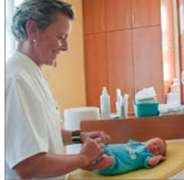
Die „Wickelinsel“ im Kinderzimmer