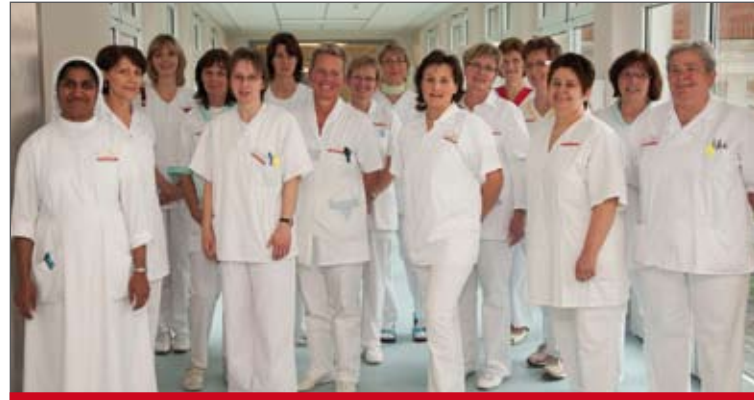
Das Team der Kinderkrankenschwestern